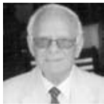
Συγγραφή: Γρηγόριος Παπαζήσης

Η ιστορική παραδοχή του Χαρίλαου Τρικούπη «Δυστυχώς επτωχεύσαμεν» στις 10 Δεκεμβρίου 1893 σηματοδοτεί τη θλιβερή κατάληξη μιας οικονομικής πολιτικής μεγάλων φιλοδοξιών και αγαθών προαιρέσεων, τα διδάγματα της οποίας δεν έχουν ακόμα, έναν αιώνα αργότερα, συζητηθεί ευρέως. Η πολιτική αυτή ανάγκασε το 1898 την Ελλάδα στην αποδοχή του Διεθνούς Οικονομικού