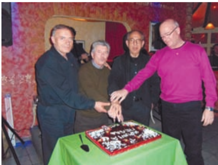
Γλυκές αναμνήσεις και νοσταλγικές θύμησες πλημμύρισαν τη «Μουσική Σκηνή» τη βραδιά που οι παλαίμαχοι έκογαν την πίτα τους απολαμβάνοντας την υπέροχη ζωντανή μουσική που τους προσέφερε τριμελής κομπανία από τη Λάρισσα