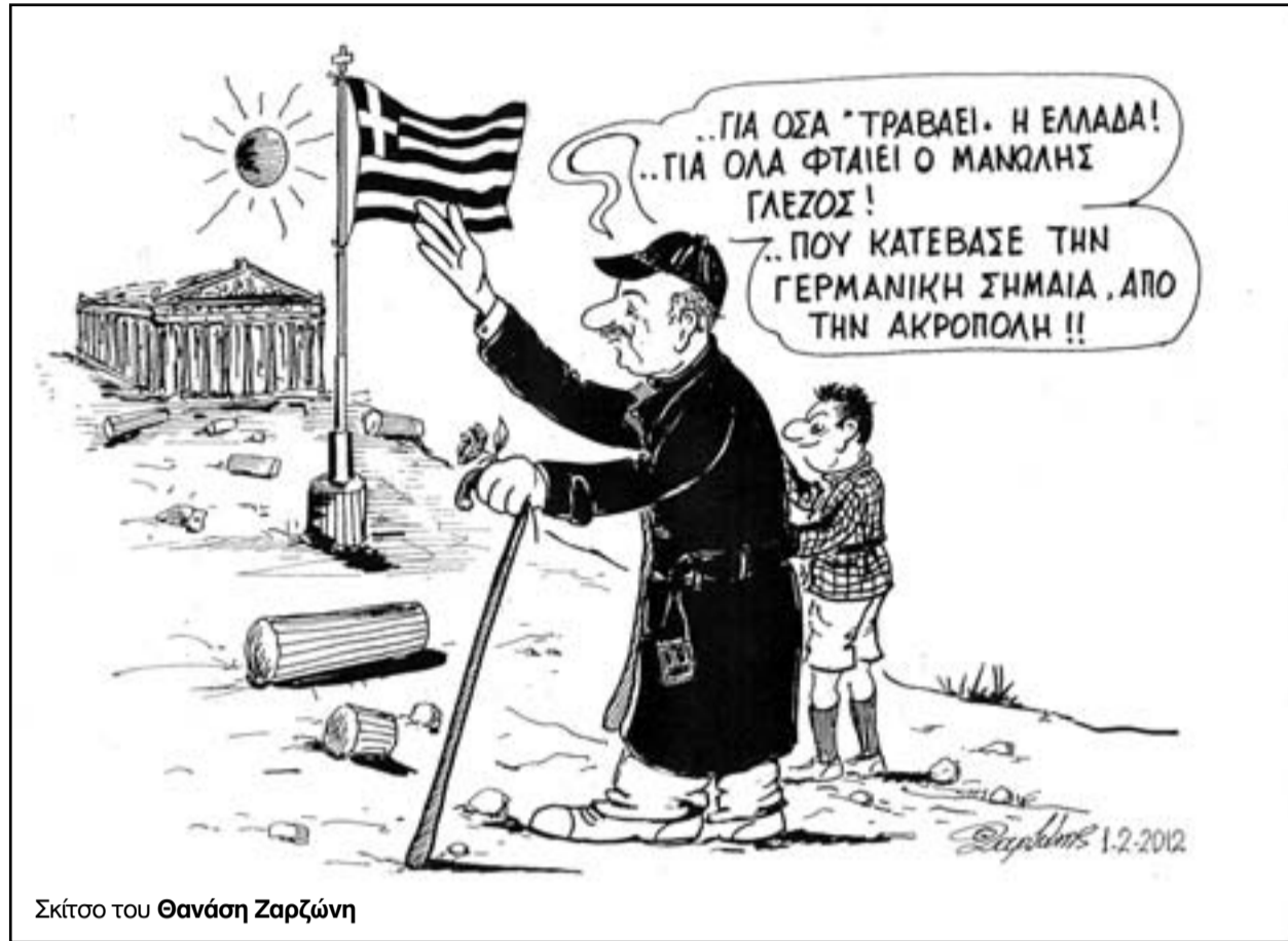
Σκίτσο του Θανάση Ζαρζώνη