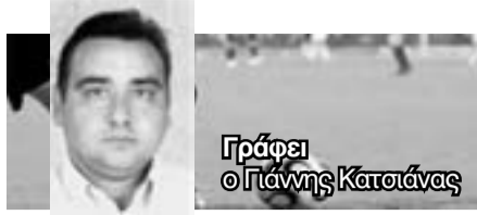
Γράφει ο Γιάννης Κατσιάνας